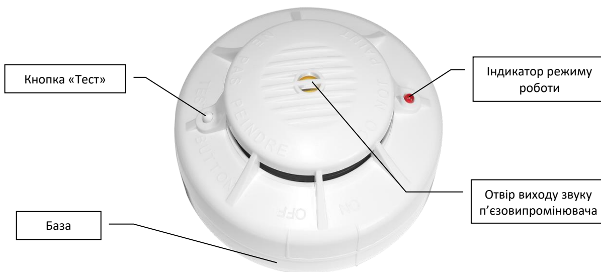
Мал. 1. Зовнішній вигляд сповіщувача «SPD-10QR»

3.3 Зовнішній вигляд сповіщувача представлений на мал 1.